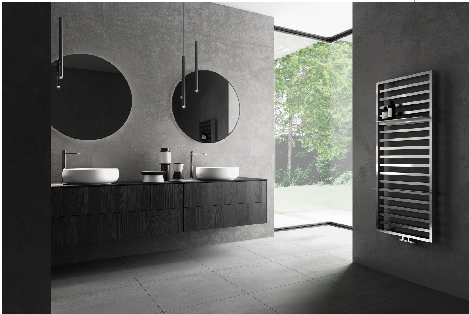
It Is, Горизонтальный 1208 mm, Длина 500 mm, Хромированный