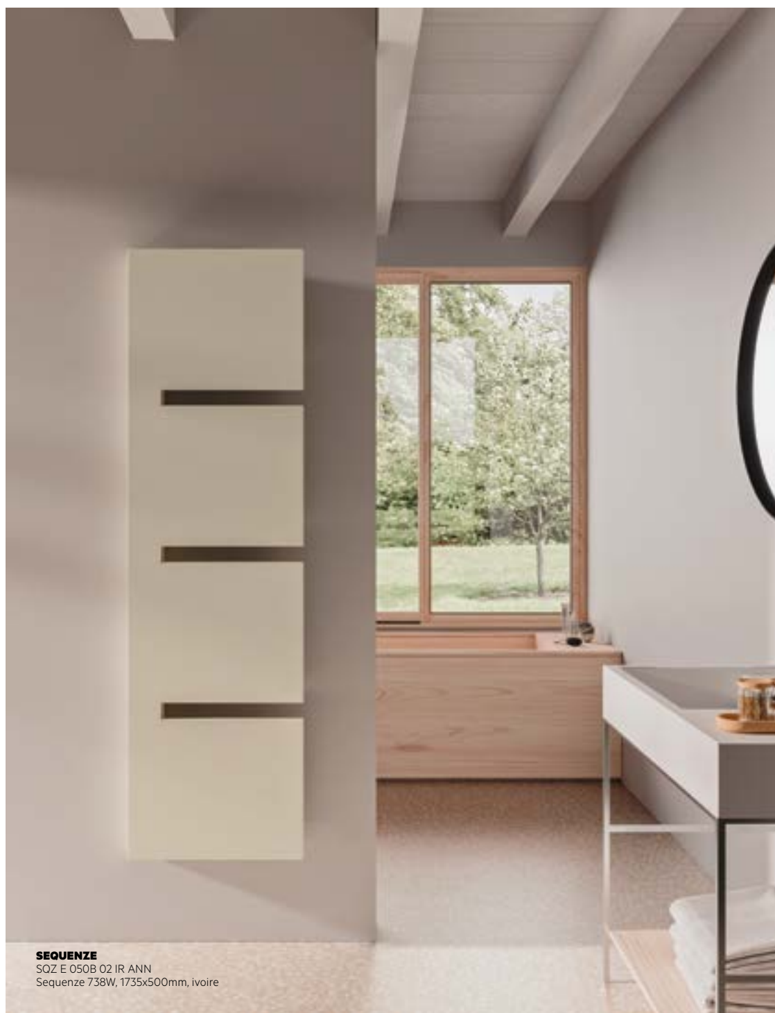
SEQUENZE SQZ E 050B 02 IR ANN Sequenze 738W, 1735x500mm, ivoire