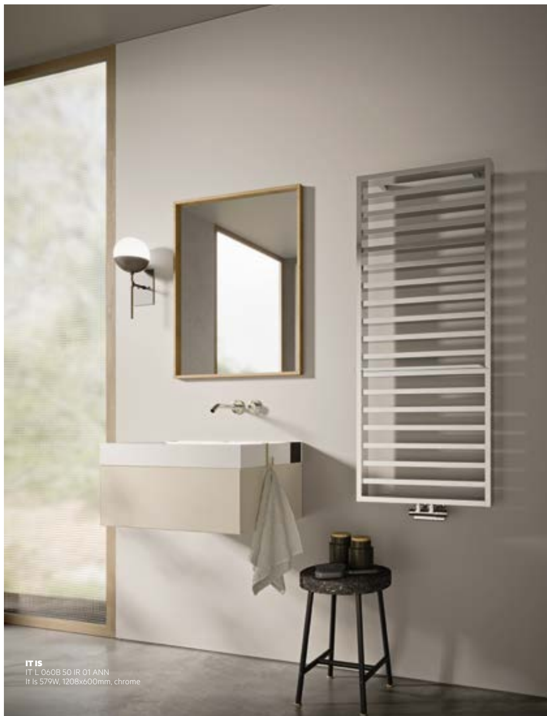
IT IS IT L 060B 50 IR 01 ANN It Is 579W, 1208x600mm, chrome