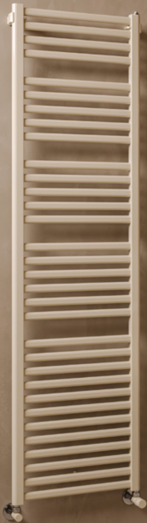
PAREO Altura 1800 mm, Anchura 500 mm. Color Marfil (Cód. 02) Serie Classic.