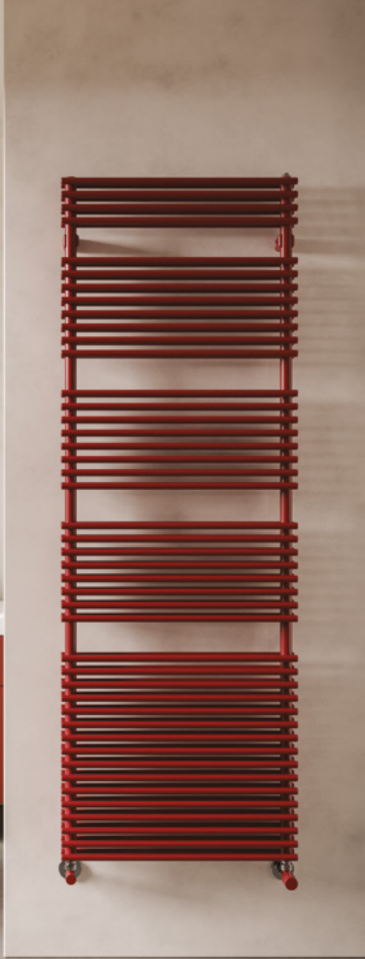
FLAUTO 2 Altura 1762 mm, Anchura 606 mm. Color Granate (Cód. 06) Serie Classic.